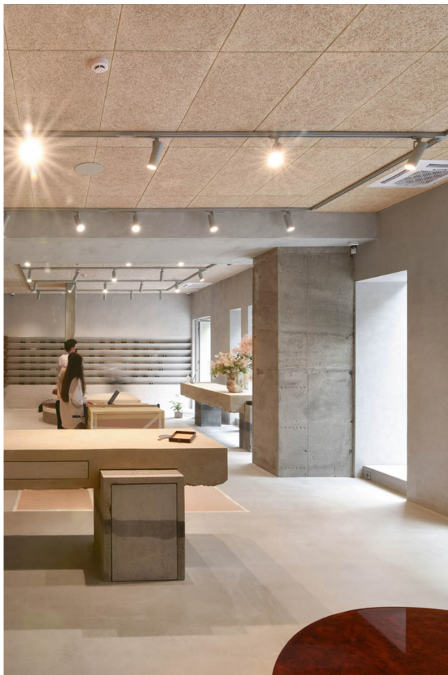
P1 PANNEAU ACCOUSTIQUE PURE BEL FIXE SUR SOUS FACE DALLE BETON EXISTANTE