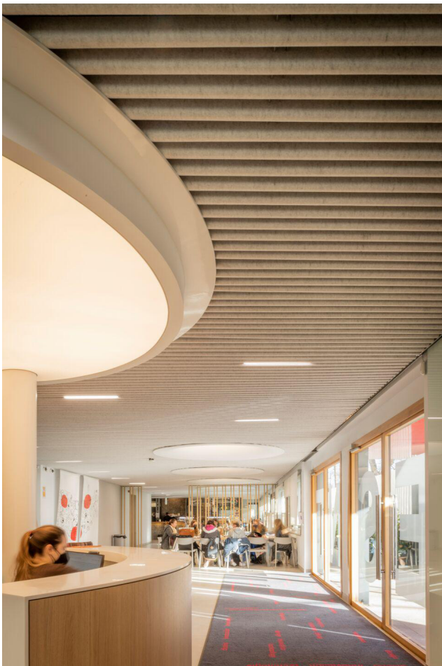
P2 FAUX PLAFOND ACCOUSTIQUE LAMES FEUTRE TYPE HEARTFELT LINEAR DE HUNTER DOUGLAS SUR OSSATURE SUPPORT