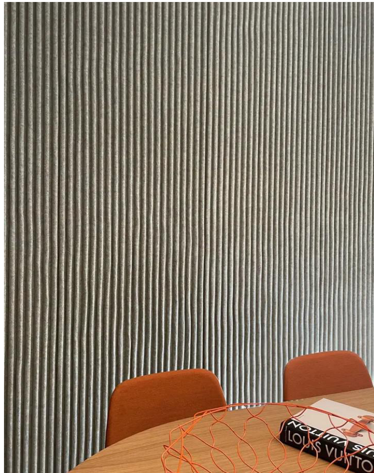
M4 REVETEMENT MURAL ACCOUSTIQUE FEUTRE TYPE TUNNEL DE SLALOM